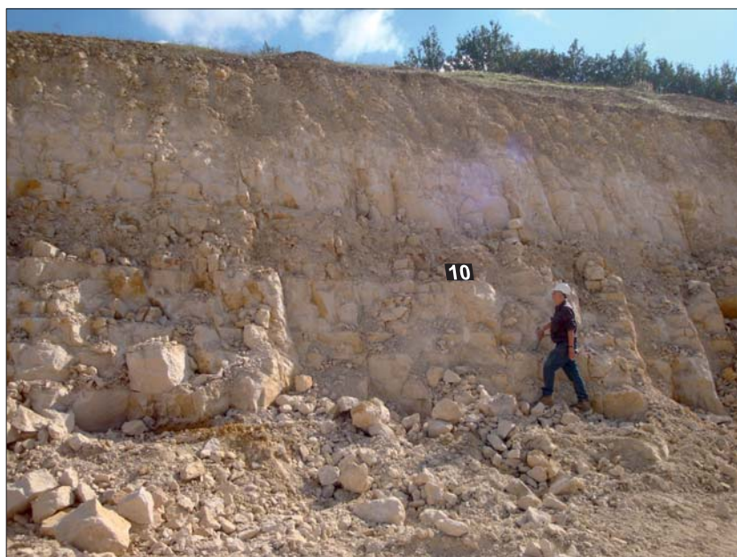
Ryc. 3. Widok wschodniej ściany kamieniołomu Pj 110 w Lisowicach pokazujący uławiczone wapienie z warstwą margli (warstwa 10) reprezentujące wyższą część poziomu Planula najniższego kimerydu (stan dzisiejszy)

Fig. 2. A – view of the part of the eastern face of Pj 92 quarry at Bobrowniki, showing the Oxfordian/Kimmeridgian boundary (arrowed) corresponding to the GSSP standard (as of 2016); B – view of the eastern face of Pj 92 quarry at Bobrowniki, corresponding in its right part to that from Fig. 2A (current state)