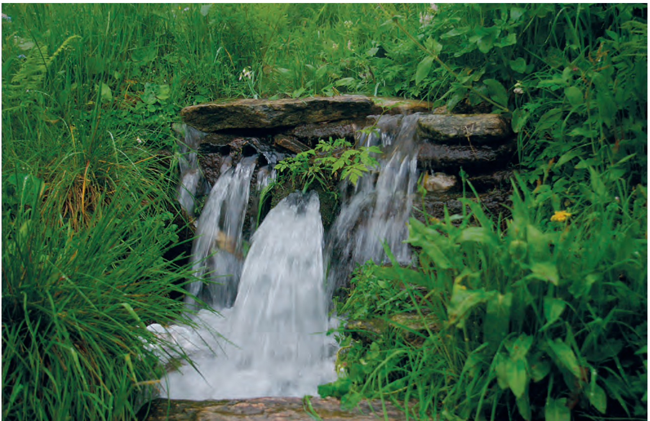
Ryc. 3. Przepływ po opadzie nawałnym w 2006 r. – „wodospad” na potoku Zagożdżonów. Wszystkie fot. K.D. Zagożdżon

Fig. 2. High water level after rainfall in Mała Młynówka (Młynowiec near Stronie Śląskie)