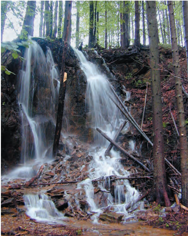
Ryc. 1. Sześciometrowej wysokości kaskada na okresowym dopływie Młynówki pod przełęczą Dział po burzowym opadzie w maju 2006 r.

Fig. 1. A six-metre-high cascade on a periodic tributary of the Młynówka stream at the Dział Pass (situation after a storm fall in May 2006)