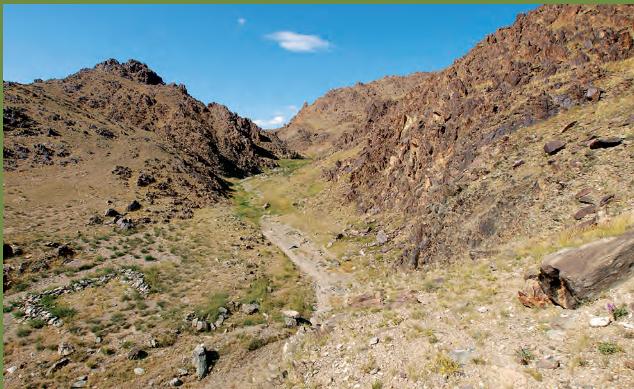
Ryc. 1. Wąwóz z wychodniami proterozoicznych skał jednostki Urgamal – typowy, stepowy krajobraz zachodniej części masywu Khasagt (zachodnia Mongolia).