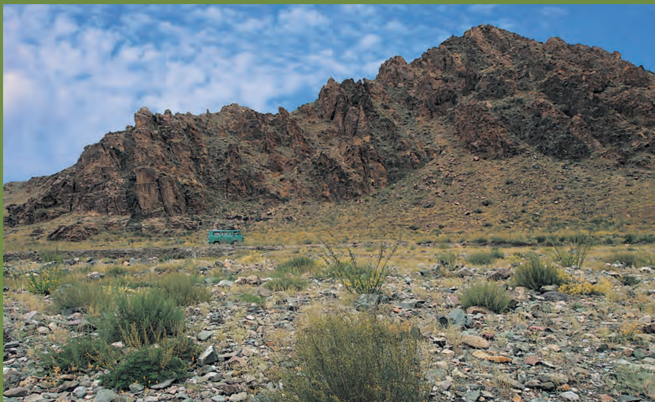
Ryc. 2. Wychodnie proterozoicznych granitoidów i mikrodiorytów ortokompleksu Dund (wąwóz Nomgon, zachodnia Mongolia)