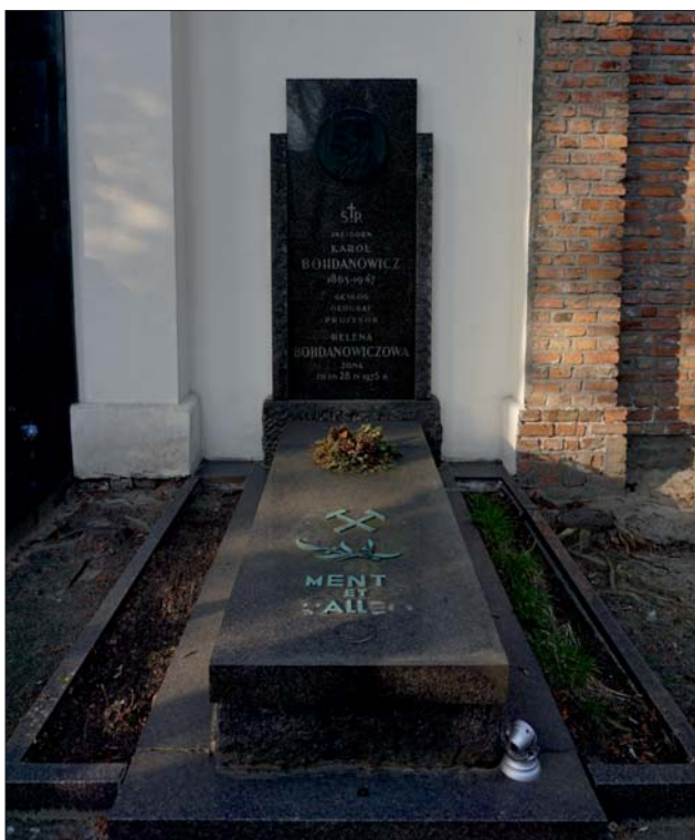
Ryc. 3. Nagrobek śp. Karola Bohdanowicza na cmentarzu Powązkowskim.