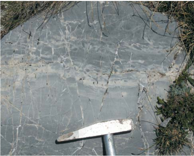
Ryc. 3. Synsedymacyjne uskoki w wapieniach anizyku, Tatricum, Giewont. Ryc. 3, 4 i 6 fot. P. Jaglarz