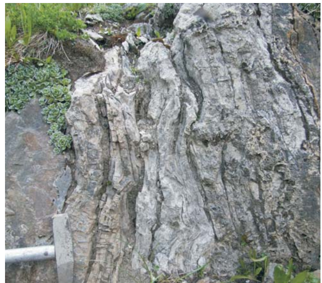
Ryc. 6. Struktury tipi w utworach anizyku, Tatricum, Długi Giewont