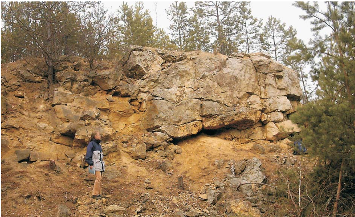
Ryc. 1. Środkowotriasowa rafa gąbkowo-koralowcowa w Tarnowie Opolskim.

Wymienione wyżej kierunki badań paleontologicznych są kontynuowane i przynoszą ciągle nowe dane. Istnieją jednak grupy organizmów, których znaczenie naukowe jest równie ważne, lecz pozostają one, jak dotąd, na marginesie zainteresowań badawczych. W pierwszej kolejności należy w tej kategorii wymienić ślimaki śląskiego wapienia muszlowego, które tworzą tu zespół o unikalnym na skalę światową gatunkowym bogactwie i znaczeniu (Hagdorn, 2007), a w drugiej — niezwykle bogaty zespół zielenic, który był obiektem szczegółowych badań prof. Zbigniewa Kotańskiego.