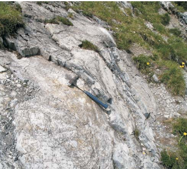
Ryc. 5. Struktury tipi rozwinięte w utworach ladynu, Patricum, Skupniów Uplaz. Ryc. 5, 7 i 8 fot. J. Szulc