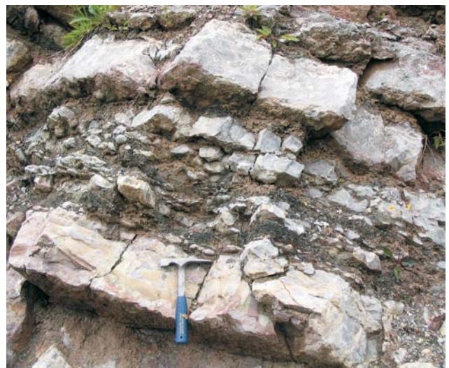
Ryc. 8. Warstwy z Reifling, z wkładkami piroklastyków, Matjašovce, Słowacja