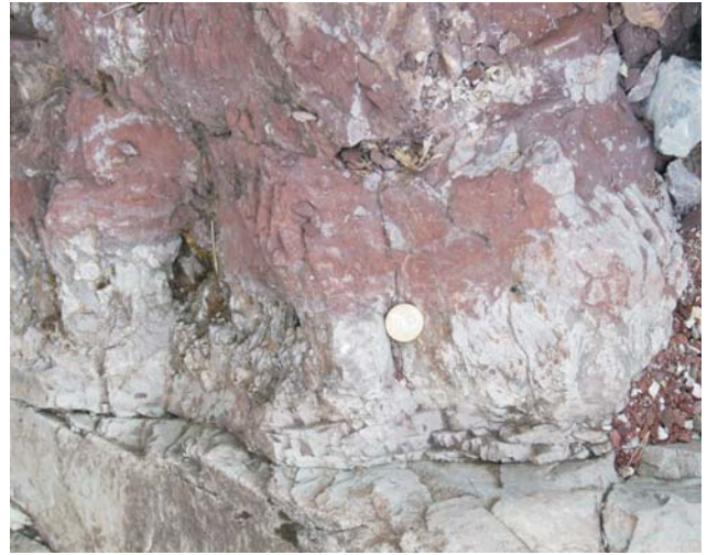
Ryc. 4. Żyły klastyczne z upłynnienia w utworach górnego triasu, Tatricum, Czerwone Żlebki