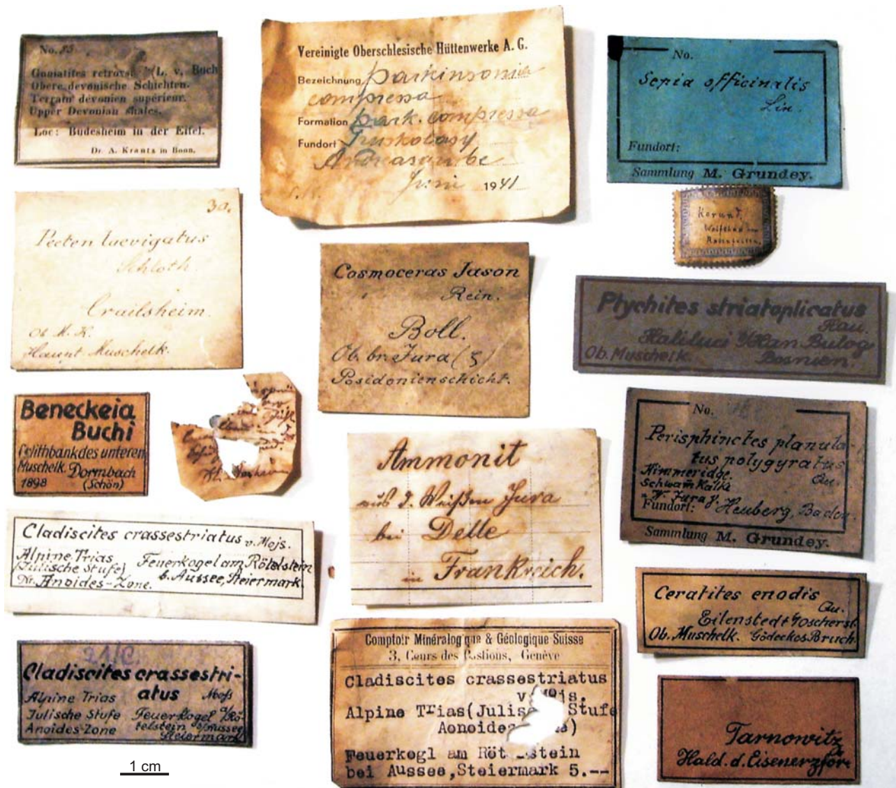
Ryc. 1. Metryczki okazów ze zbiorów Muzeum Geologii Złóż

informacja na temat taksonomii, lokalizacji i wieku była umieszczona bezpośrednio na eksponacie (ryc. 2B).