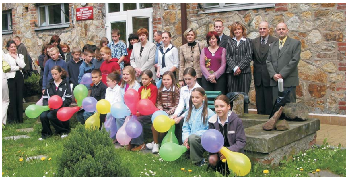
Ryc. 3. Finałiści konkursu Oddziału Świętokrzyskiego PIG.