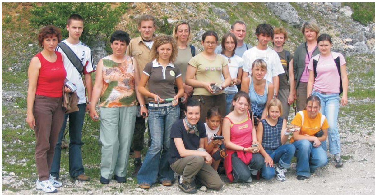
Ryc. 4. Uczestnicy wycieczki geologicznej dla laureatów konkursu Oddziału Górnośląskiego PIG.