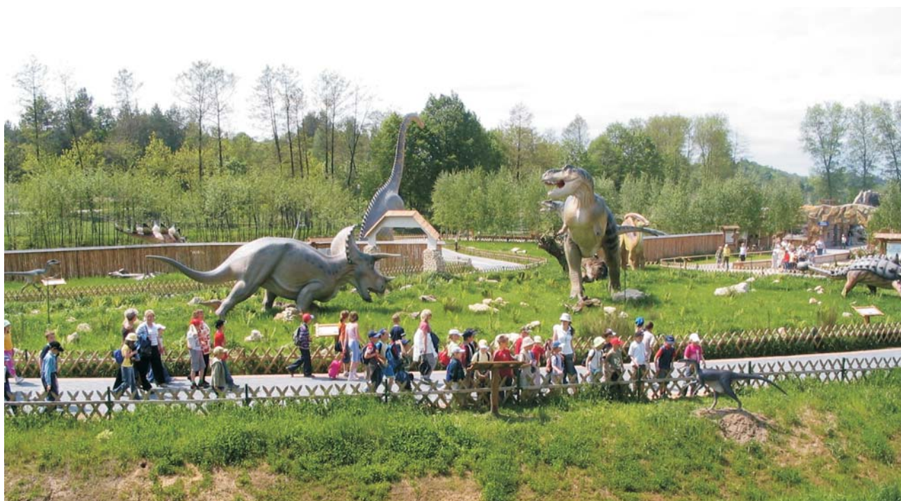
Ryc. 3. Fragment Bałtowskiego Parku Jurajskiego