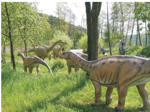
Ryc. 1. Stado vulkanodonów. Ryc. 2–4. Arch. Stow. DELTA