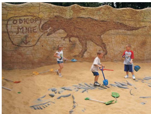
Ryc. 4. Odkopywanie szkieletu tyranozaura na placu zabaw