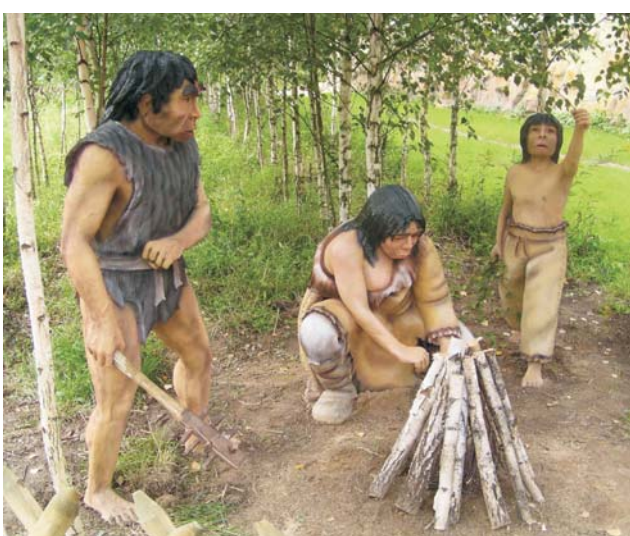
Ryc. 2. Fragment obozowiska człowieka z epoki neolitu