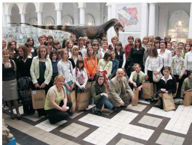
Ryc. 3. Pamiątkowe zdjęcie laureatów części półfinałowej konkursu w Warszawie.

Impreza przebiegała tradycyjnie w dwóch kategoriach. Uczniowie klas IV–VI szkół podstawowych Polski i Litwy uczestniczyli w konkursie plastycznym. Zadaniem uczestników było wykonanie pracy plastycznej (ograniczeniem inwencji młodych „artystów” była płaska forma pracy i