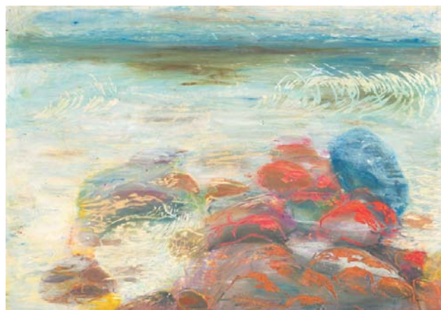
Ryc. 2. Angelika Zakrzewska — nagroda publiczności w konkursie ogólnopolskim