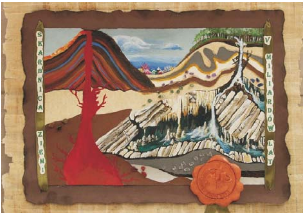
Ryc. 5. Monika Pluta — III miejsce w konkursie ogólnopolskim