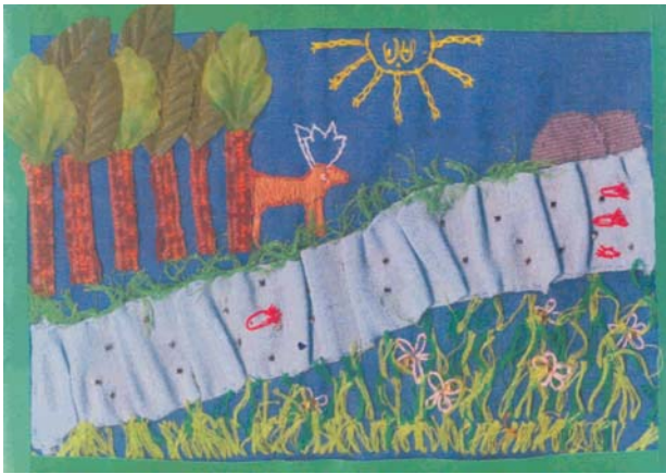
Ryc. 4. Greta Čerškute — I miejsce w konkursie litewskim