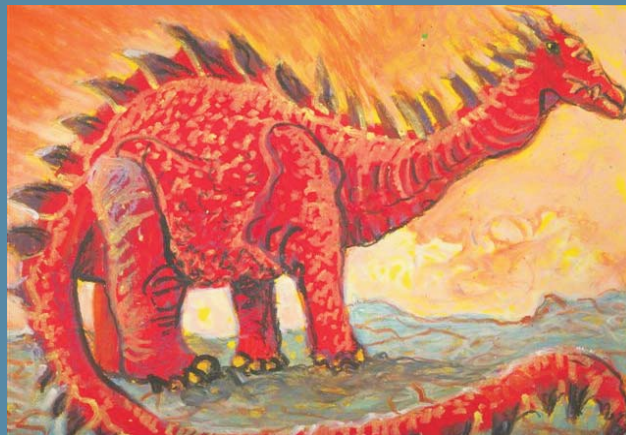
Ryc. 3. Weronika Nizalowska