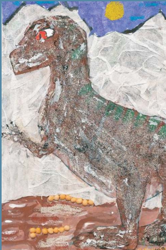
Ryc. 2. Karolina Pociute — I miejsce w litewskiej części konkursu