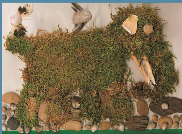
Ryc. 6. Giedre Adamonyte