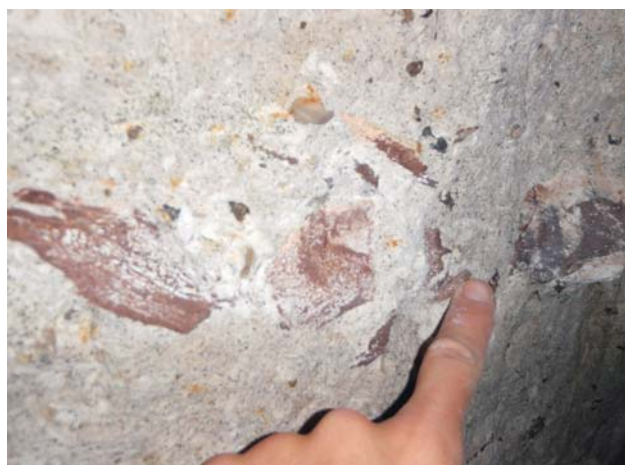
Ryc. 6. Nagromadzenie kości w marglach cenomanu