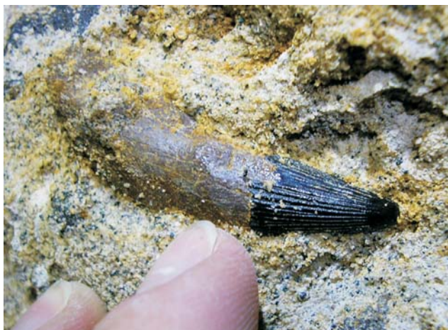
Ryc. 5. Ten sam ząb, co na ryc. 4, w zbliżeniu