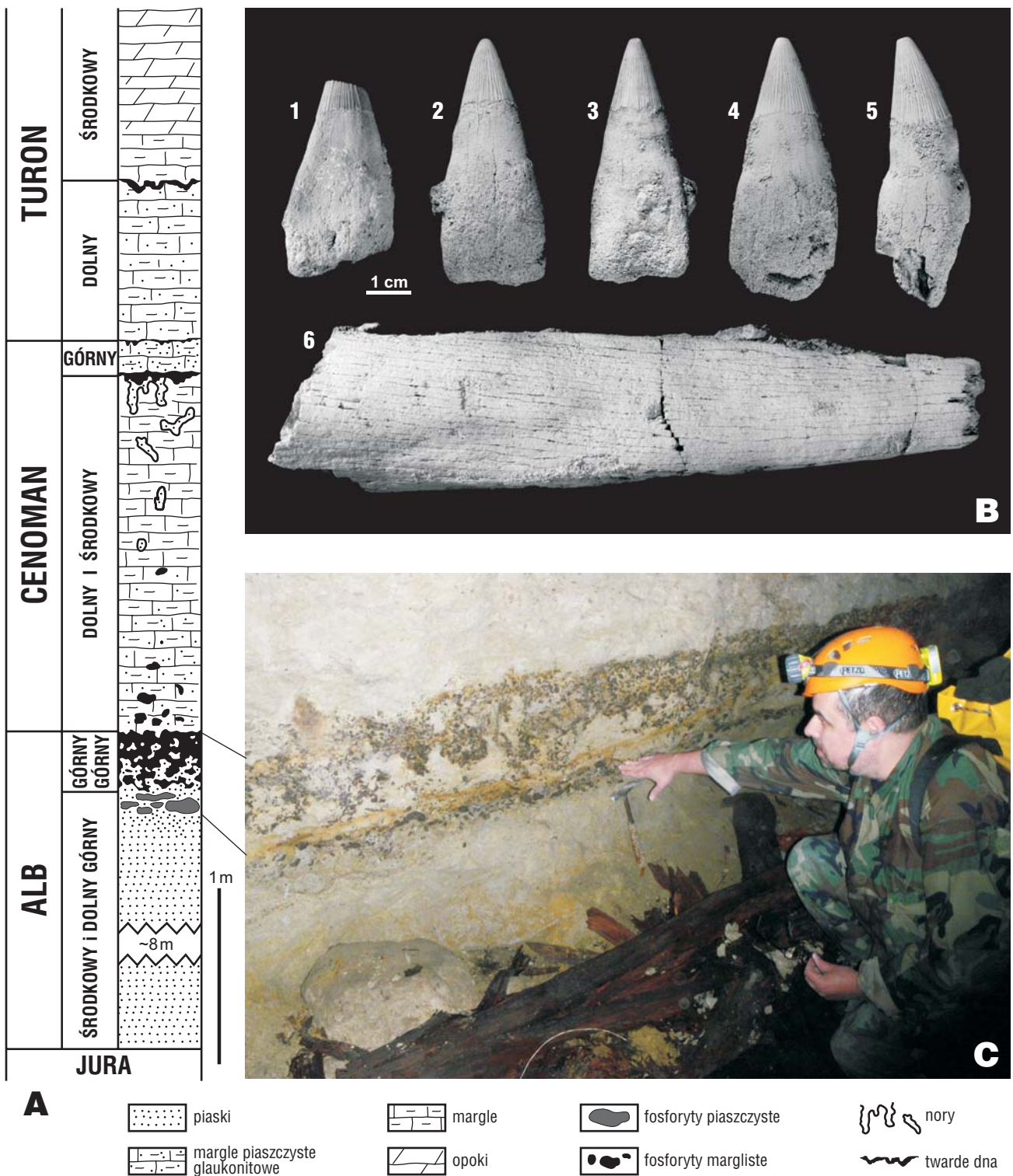
Ryc. 2. A — Profil utworów kredowych antykliny Annapola (wg Walaszczyka, 1984, 1987, zmodyfikowany); B — Szczątki ichtiozaura z gatunku Platypterygius campylodon (Carter), górna część poziomu fosforytowego (zbiory Instytutu Paleobiologii PAN), zęby: ZPAL V. 38/1 (B1), ZPAL V. 38/2 (B2–3) i ZPAL V. 38/3 (B4–5) oraz fragment szczęki ZPAL V. 38/4 (B 6); C — Fragment wyrobiska kopalni, w którym odsłania się poziom fosforytowy albu; widoczna dwudzielna budowa poziomu (M. Machalski wskazuje jego dolną część) oraz silna bioturbacja górnej części poziomu fosforytowego.

z których Platypterygius campylodon (Carter) należy do ichtiozaurów, zaś Polyptychodon interruptus Owen reprezentuje plezjozaury (a ściślej pliozaury, czyli grupę plezjozaurów, której przedstawiciele charakteryzowali się krótkimi szypkami oraz stosunkowo dużymi głowami).