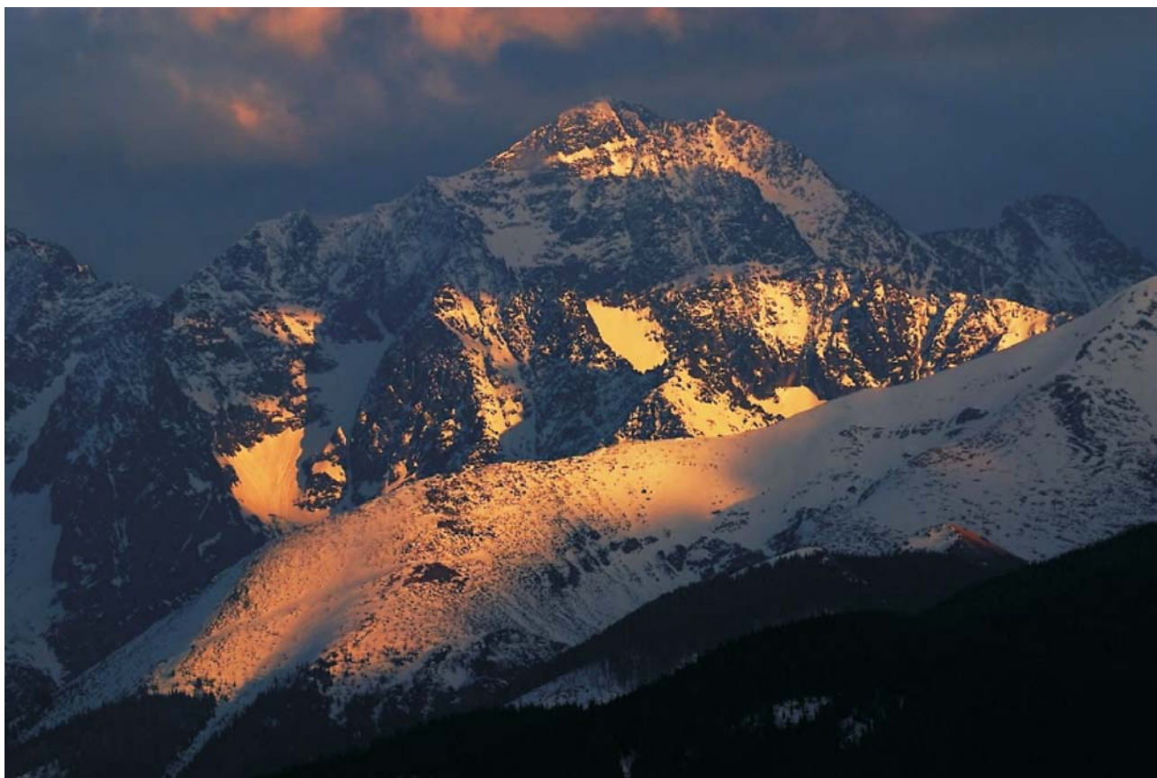
Ryc. 1. Piękne i groźne