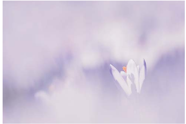
Ryc. 3. Posłaniec wiosny

Autor fotografii – Michał Budzyński – to młody i niezwykle utalentowany fotograf przyrody, z licznymi osiągnięciami w tej dziedzinie sztuki. Prezentowany zbiór zdjęć jest już jego szóstą indywidualną wystawą. Zdjęcia tego autora były wielokrotnie nagradzane i wyróżniane w krajowych oraz międzynarodowych konkursach fotografii przyrodniczej. W najnowszej edycji jednego z najbardziej prestiżowych konkursów – BBC Wildlife Photographer of the Year – Michał Budzyński zdobył drugie miejsce. Wcześ-