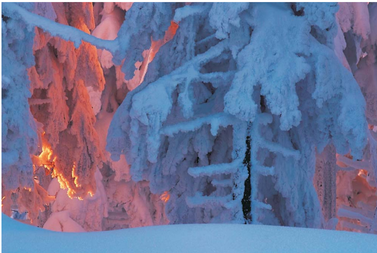
Ryc. 2. Rozzarrony las.