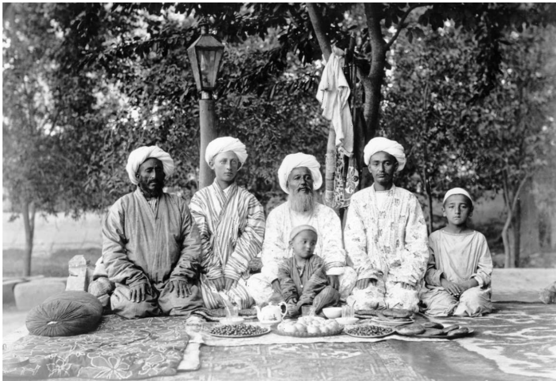
Ryc. 4. Poczęstunek u samarkan.

widoki miejscowości i portrety mieszkańców Azji. Z niezwykle bogatego zbioru fotografii Barszczewskiego do dziś przetrwały nieliczne. Część z nich mamy przyjemność zaprezentować na wystawie w Muzeum Ziemi.