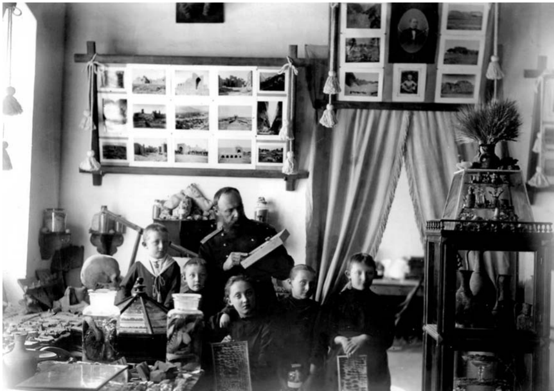
Ryc. 3. W pracowni muzeum.