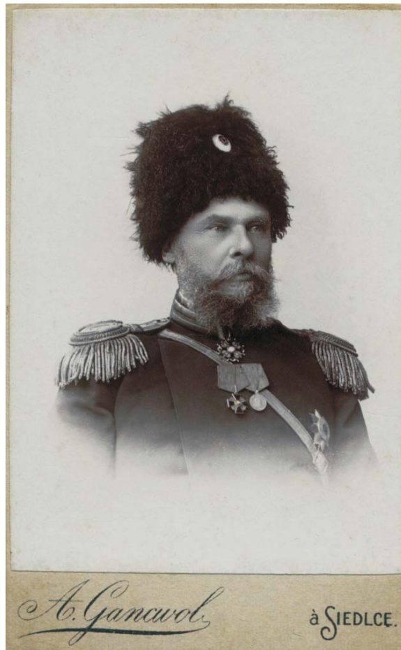
Ryc. 1. Leon Barszczewski.

Przygodę z fotografią Leon Barszczewski rozpoczął jeszcze przed wyjazdem do Azji Środkowej. Poznawszy możliwości jakie dawała ta, nowa wówczas, metoda rejestracji obrazu, w pełni świadomie posługiwał się nią podczas swoich wypraw, używając aparatu fotograficznego zarówno do dokumentacji badań, jak i rejestracji obiektów, które z racji na piękno zasługiwały jego zdaniem na utrwalenie. Wykonane przez Barszczewskiego cykle zdjęć znalazły uznanie wśród specjalistów i zostały nagrodzone złotymi medalami na wystawach fotograficznych: w 1895 roku w Paryżu za fotografie lodowców azjatyckich oraz w 1901 roku w Warszawie za