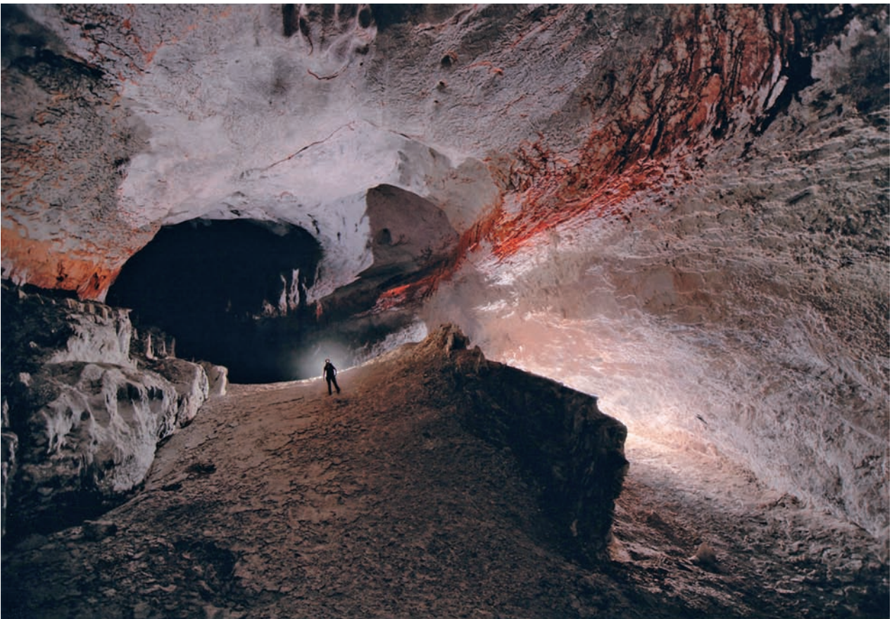
Ryc. 4. The Lonesome Explorer – Robbie Shone (Wielka Brytania), Clearwater River Cave, Borneo