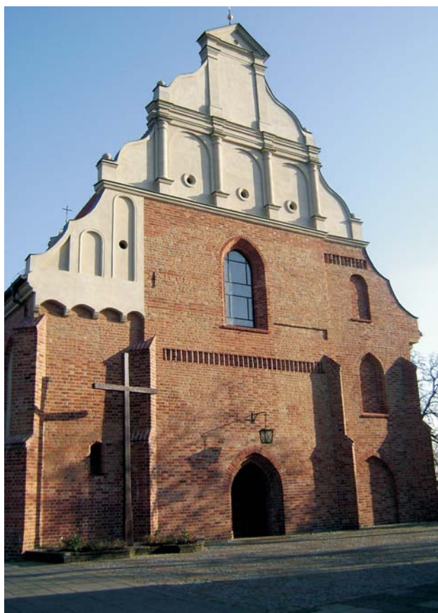
Ryc. 4. Kościół św. Wojciecha na Wzgórzu św. Wojciecha w Poznaniu, gdzie znajduje się Krypta Zasłużonych Wielkopolan