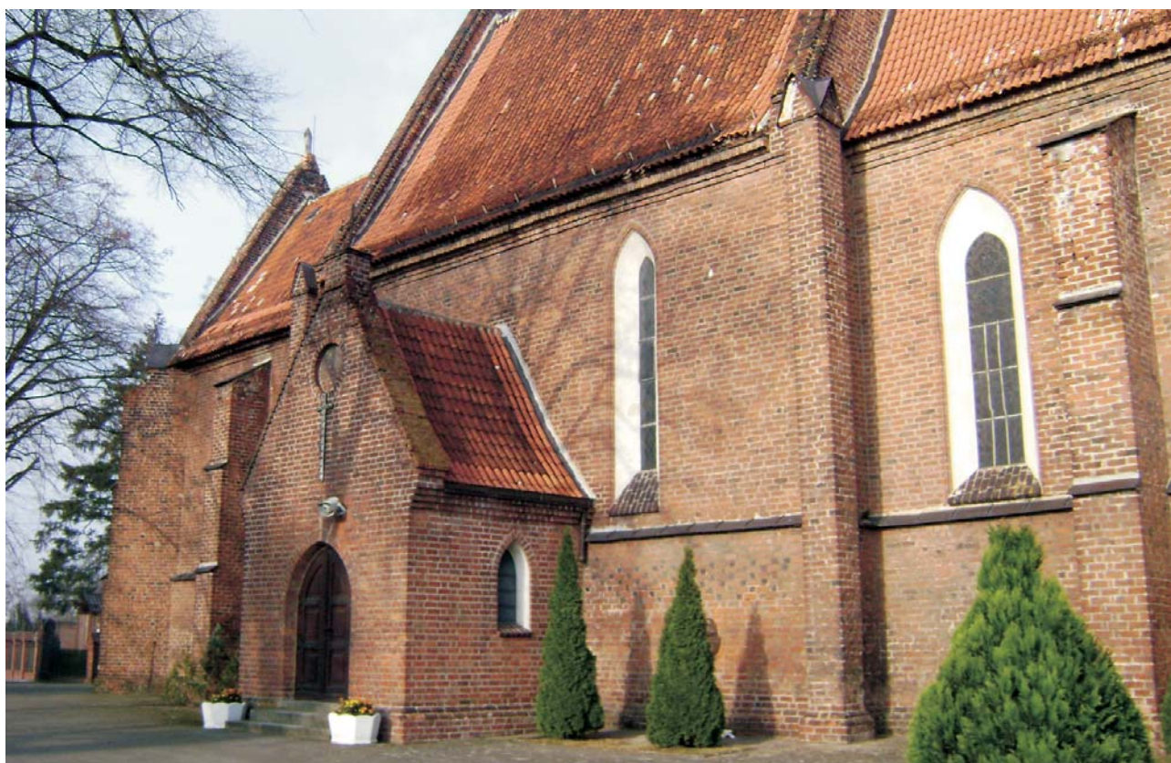
Ryc. 1. Kościół św. Jakuba Apostoła w Głuszynie, w którym P.E. Strzelecki został ochrzczony.