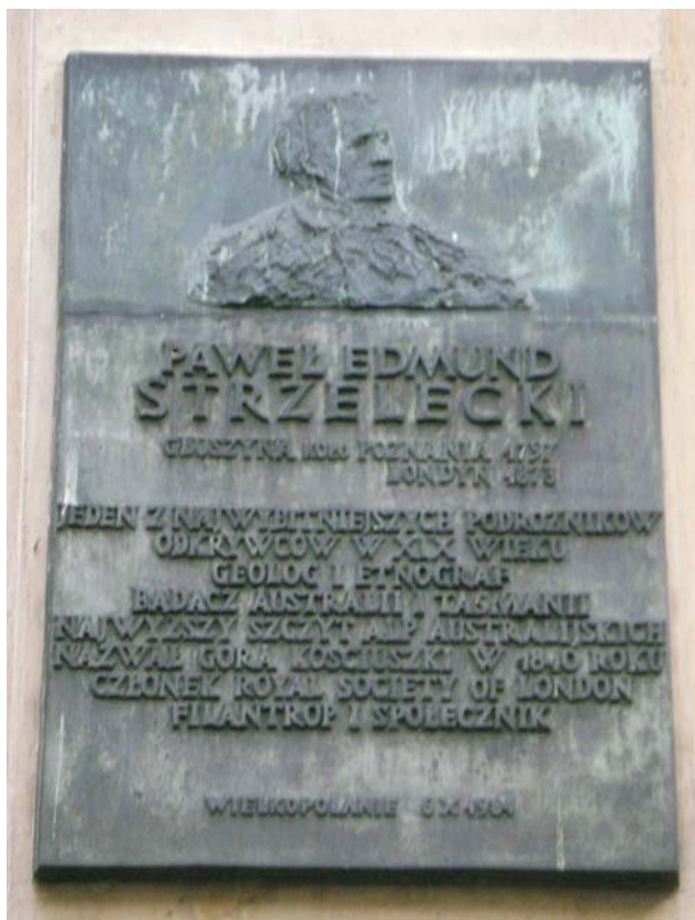
Ryc. 5. Tablica upamiętniająca P.E. Strzeleckiego zawieszona na jednym z murów dziedzińca Poznańskiego Towarzystwa Przyjaciół Nauk

Paweł Edmund Strzelecki zmarł 6 października 1873 r. w swoim mieszkaniu w Londynie. Pochowany został na cmentarzu Kensal Green w stolicy Wielkiej Brytanii. W 1977 r. Jego prochy sprowadzono z Londynu i złożono w Krypcie Zasłużonych Wielkopolan na Wzgórzu św. Wojciecha w Poznaniu (ryc. 4). W ten sposób Ojczyzna doceniła Jego długoletnią pracę naukową oraz działalność filantropijną. W stolicy Wielkopolski, oprócz wspomnianej krypty, na ulicy Mielżyńskiego na jednym z murów dziedzińca Poznańskiego Towarzystwa Przyjaciół Nauk umieszczona znajduje się tablica upamiętniająca Strzeleckiego (ryc. 5). Zawieszona jest po prawej stronie, za pomnikiem Adama Mickiewicza. W Poznaniu znajduje się również Gimnazjum nr 53 im. Pawła Edmunda Strzeleckiego.