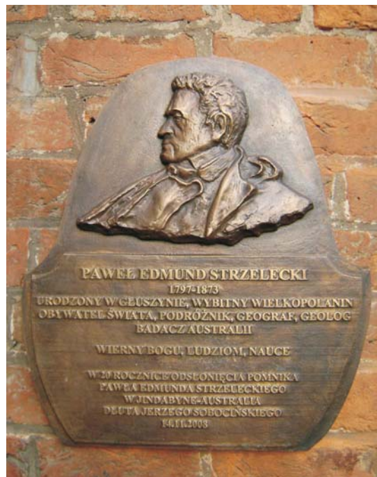
Ryc. 2. Pamiątkowa tablica poświęcona P.E. Strzeleckiemu umieszczona na murach kościoła w Głuszynie