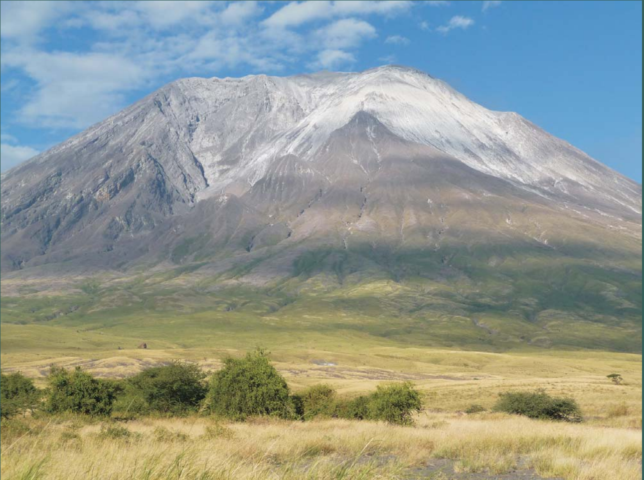
Ryc. 3. Wulkan Ol Doinyo Lengai – jedyny aktywny współcześnie wulkan Pogórza Kraterów Ngorongoro, z okresowymi erupcjami lawy węglanowej.