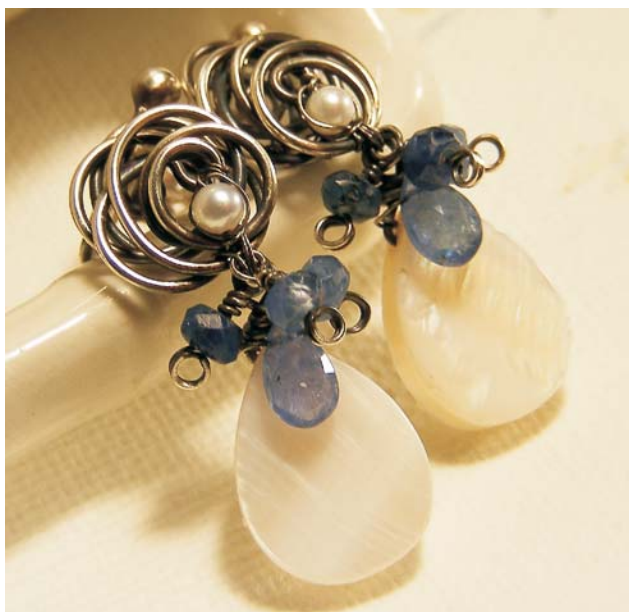
Ryc. 5. Wyroby jubilerskie z tanzanitu.

Wyspy archipelagu u wybrzeży Tanzanii (Zanzibar, Pemba, Mafia i kilka mniejszych) to głównie nizinne wyspy koralowe, zbudowane przede wszystkim z wapieni (ryc. 4 – patrz na str. 592). Największy jest Zanzibar (1700 km 2 powierzchni), który od kontynentu afrykańskiego oddzielony jest kanałem mającym w najwęższym miejscu około 36 km. Wyspy są częścią dawnej delty Rufidzi – Ruvu, która uformowała się w miocenie (Kent i in., 1971), dlatego też wapienie w różnym stopniu przykryte są przez piaski i łył naniesione przez rzeki z głębi kontynentu. Ogromna ilość wapieni koralowcowych na całym archipelagu świadczy o tym, że przez długi czas był on przykryty przez morze. Procesy izostacyjne oraz tektoniczne w strefie przybrzeżnej Tanzanii spowodowały, że fragmenty bloków dawnej delty wynurzyły się ponad powierzchnię oceanu i utworzyły współczesny archipelag. Współczesna rafa