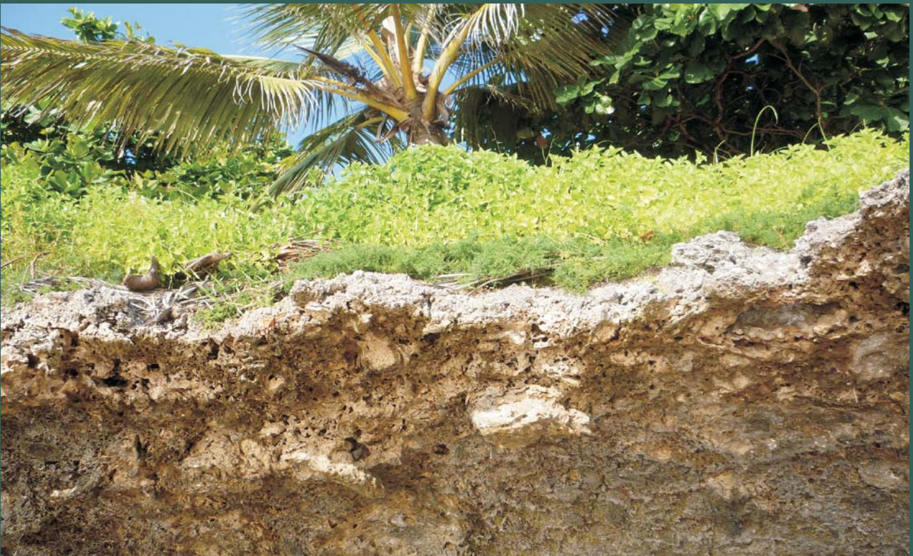
Ryc. 4. Wapnienie zbudowane z kenozoicznych korałów u brzegów wyspy Zanzibar.