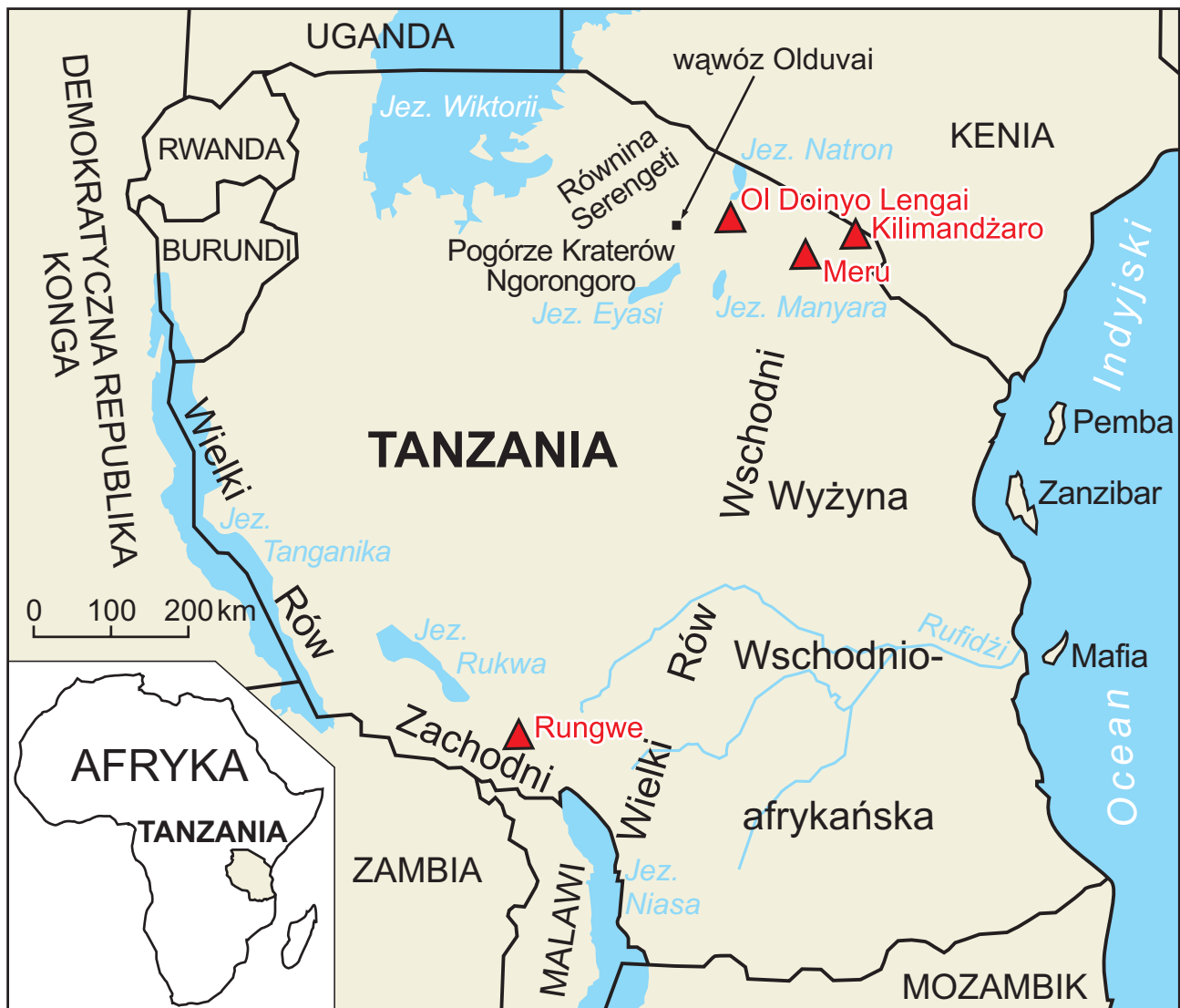
Ryc. 1. Mapa lokalizacyjna Tanzanii z zaznaczonymi miejscami omówionymi w tekście

płaskowyż urozmaicony pojedynczymi szczytami górskimi. Masywy górskie powstawały w dwóch okresach: Pasma Gol, zbudowane z granitów i położone na północ od głównej drogi w kierunku równiny Serengeti, liczy 500 mln lat, znacznie młodsze jest natomiast Pogórze Kraterów oraz pojedyncze stożki wulkaniczne, podlegające tym samym procesom tektonicznym, które uformowały Dolinę Ryftową, i które zostały utworzone 15 do 20 mln lat temu. Główny krater Ngorongoro jest pozostałością wielkiego wulkanu, który – zanim doszło do jego gwałtownej erupcji około 3 mln lat temu – pod względem wysokości dorównywał Kilimandżaro. Obecna kaldera Ngorongoro jest jedną z sześciu największych na świecie (głębokość około 600 m) i jako jedyna posiada zachowane ściany. Osiem mniejszych kraterów znajdujących się w obrębie rezerwatu, a zwłaszcza Olmoti oraz Empakaai, powstały w wyniku podobnych co Ngorongoro erupcji. Wulkany Pogórze Kraterów nie są obecnie aktywne, jakkolwiek pojedynczy wulkan Ol Doinyo Lengai (ryc. 3 – patrz na str. 592), usytuowany około 20 km na północny wschód od głównego pasma pogórze, należy do najbardziej aktywnych na świecie.