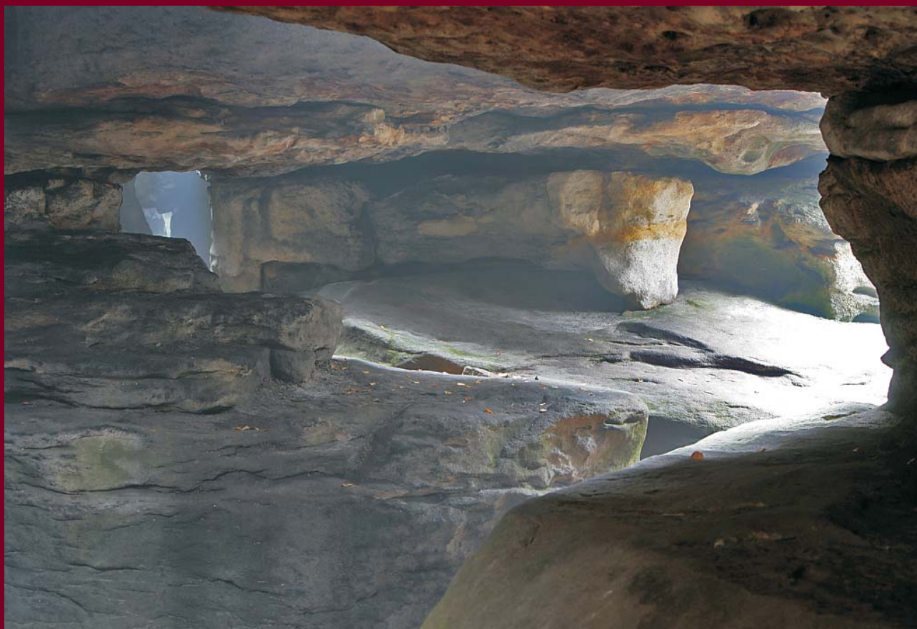
Ryc. 4. Błędne Skały. Fot. M. Lejbrandt