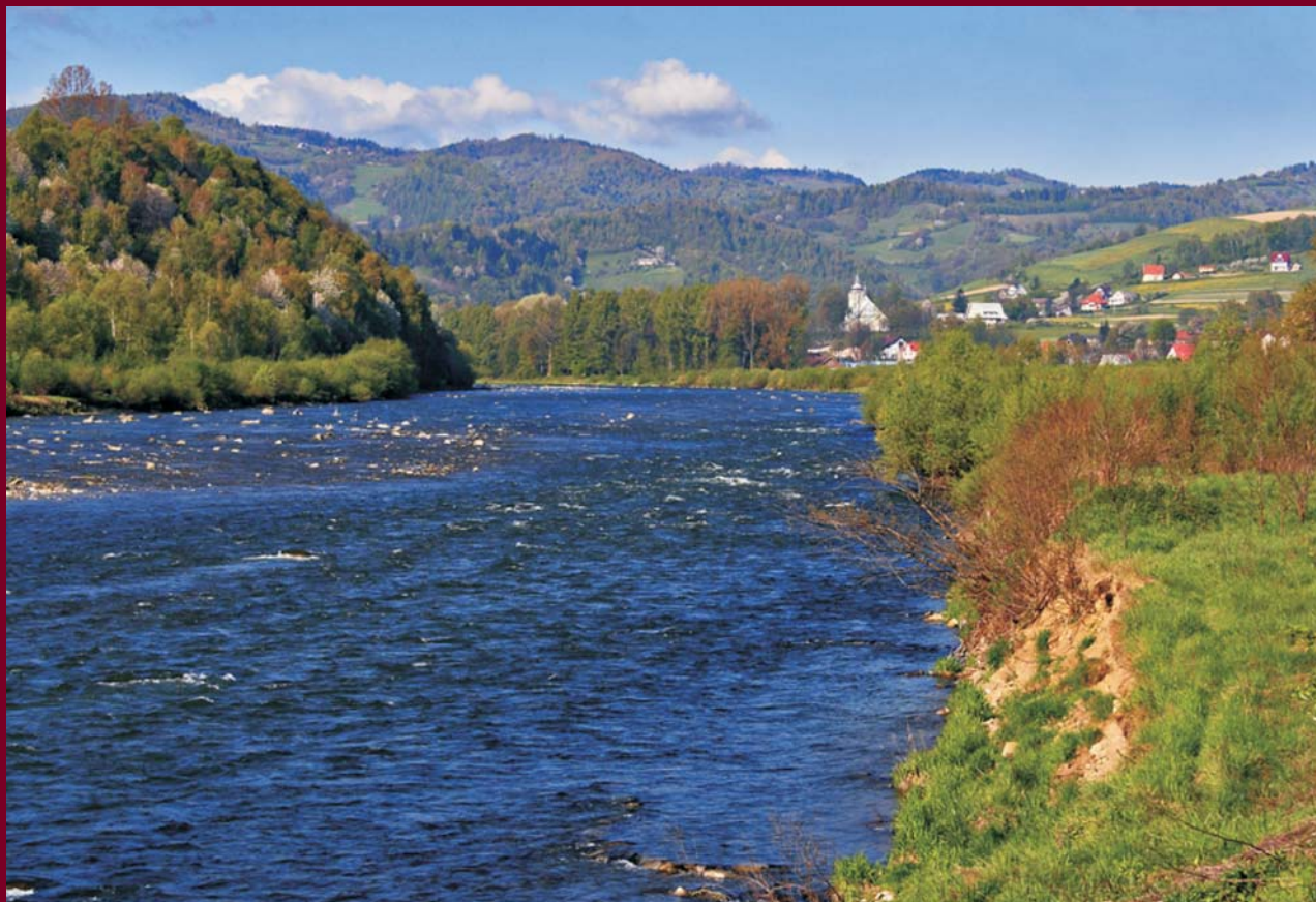
Ryc. 3. Dunajec.