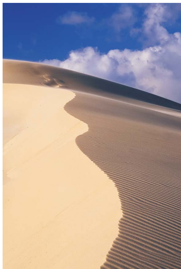
Ryc. 2. Słowiński Park Narodowy.

w jesiennej i letniej scenerii, przepiękne zimowe widoki Nadbużańskiego Parku Krajobrazowego czy też ruchome wydmy na terenie Słowińskiego Parku Narodowego. Oprócz fotografii krajobrazu jest też miejsce na zdjęcia etnograficzne, przedstawiające ginącą kulturę ludową. Zobaczymy kapliczkę z figurą św. Jana Nepomucena,