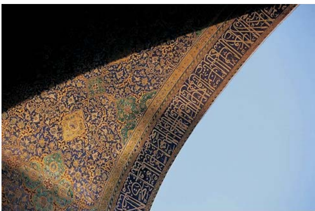
Ryc. 7. Esfahan, 2008