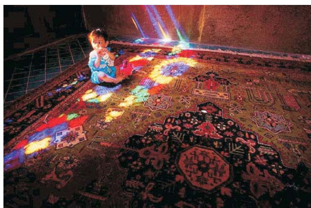
Ryc. 6. Shiraz, 2008