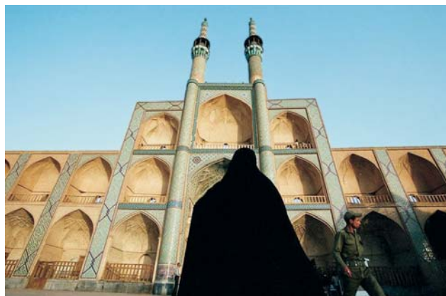
Ryc. 3. Yazd, 2008