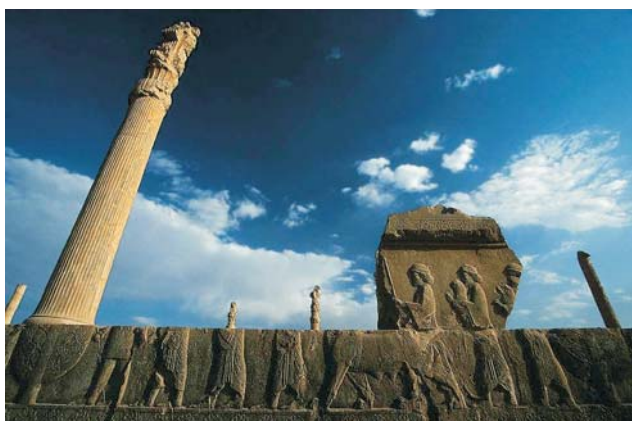
Ryc. 4. Persepolis, 2008