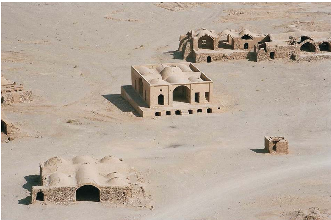
Ryc. 1. Yazd, 2008

Efekty tej podróży w postaci niepowtarzalnych fotografii można było obejrzeć w maju w Muzeum Ziemi PAN. Zdjęcia, zanim trafiły do Warszawy, były prezentowane na wystawach w Japonii i Portugalii. Większość z 29 barwnych fotografii przedstawiała zabytki muzułmańskiej