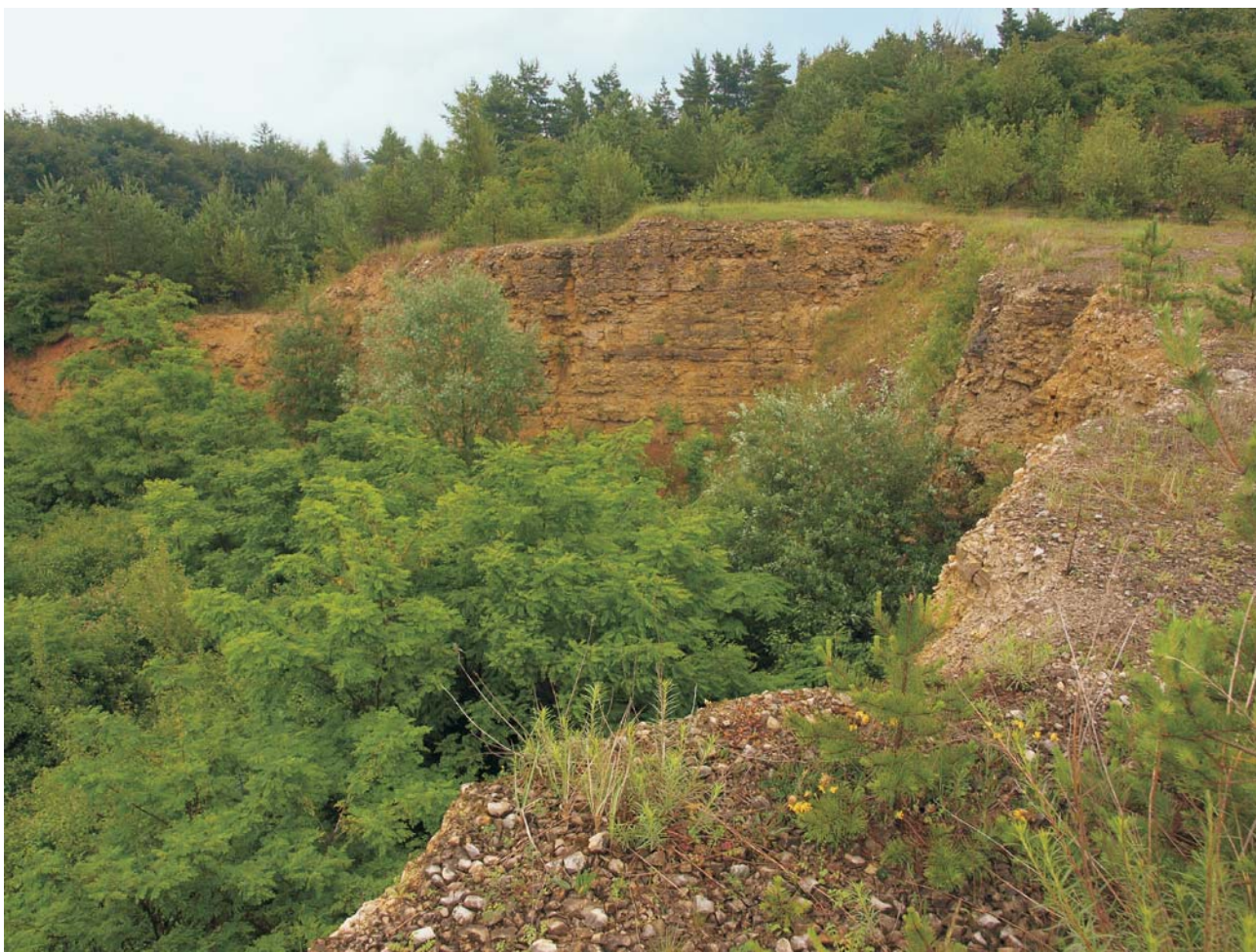
Ryc. 6. Kamieniołom Ligota Dolna, Geopark Góra Św. Anny. Fig. 6. Quarry Ligota Dolna, St. Anne's Mountain Geopark.

ośrodków naukowych i innych podmiotów regionalnych dla idei ochrony dziedzictwa geologicznego.