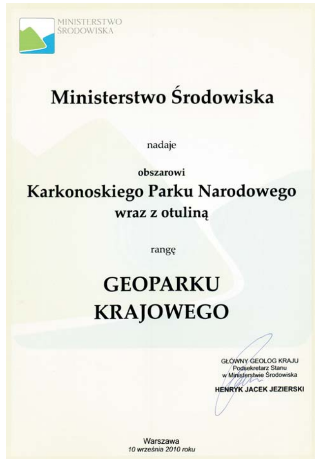
Ryc. 3. Certyfikat Geoparku Krajowego dla Karkonoskiego Parku Narodowego. Ryc. 2–3 fot. z archiwum Ministerstwa Środowiska Fig. 3. National Geopark Certificate – Karkonosze National Park. Figs. 2–3 photo from the Ministry of the Environmental archive

geoturystyczne. Geoturystyka może stanowić szansę na rozwój poszczególnych regionów poprzez zwiększenie atrakcyjności turystycznej danego obszaru oraz integrację lokalnej społeczności w budowaniu tożsamości turystycznej. Istnieje bardzo bogata oferta dla samorządów lokalnych w zakresie rozwijania geoturystyki. Zawiera ona tworzenie stanowisk, ścieżek geologicznych, geotropów oraz wiele innych możliwości współpracy z gminami, miastami i prywatnymi inwestorami zainteresowanymi rozwojem turystycznym swojego regionu.