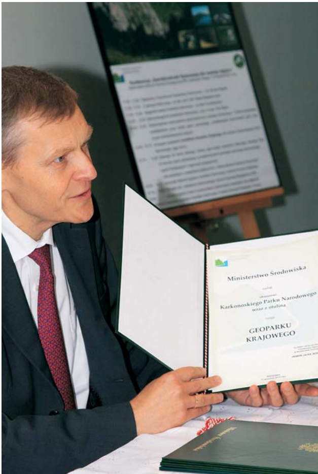
Ryc. 2. Główny geolog kraju podczas podpisania Certyfikatu Geoparku Krajowego dla Karkonoskiego Parku Narodowego Fig. 2. Chief National Geologist during the signing of the Certificate of National Geopark for Karkonosze National Park