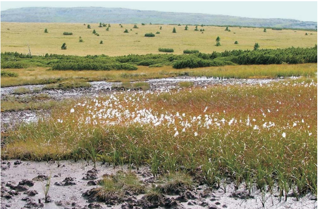
Ryc. 5. Płat roślinności z wielianką wąskolistną, Karkonoski Park Narodowy. Fig. 5. Common cottongrass, Karkonosze National Park.