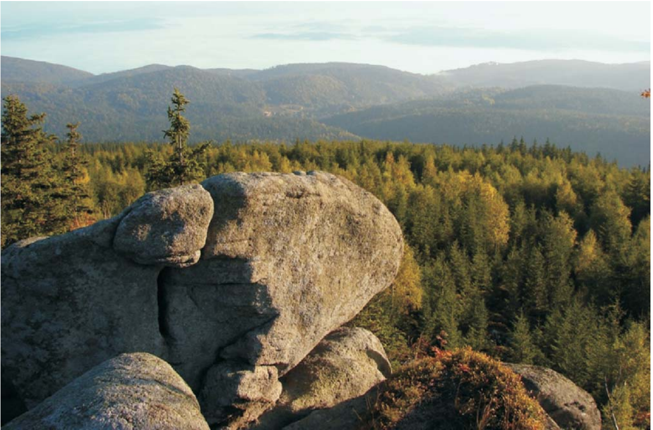
Ryc. 4. Bażynowe Skály, Karkonoski Park Narodowy. Fig. 4. Bażyna Rocks, Karkonosze National Park.