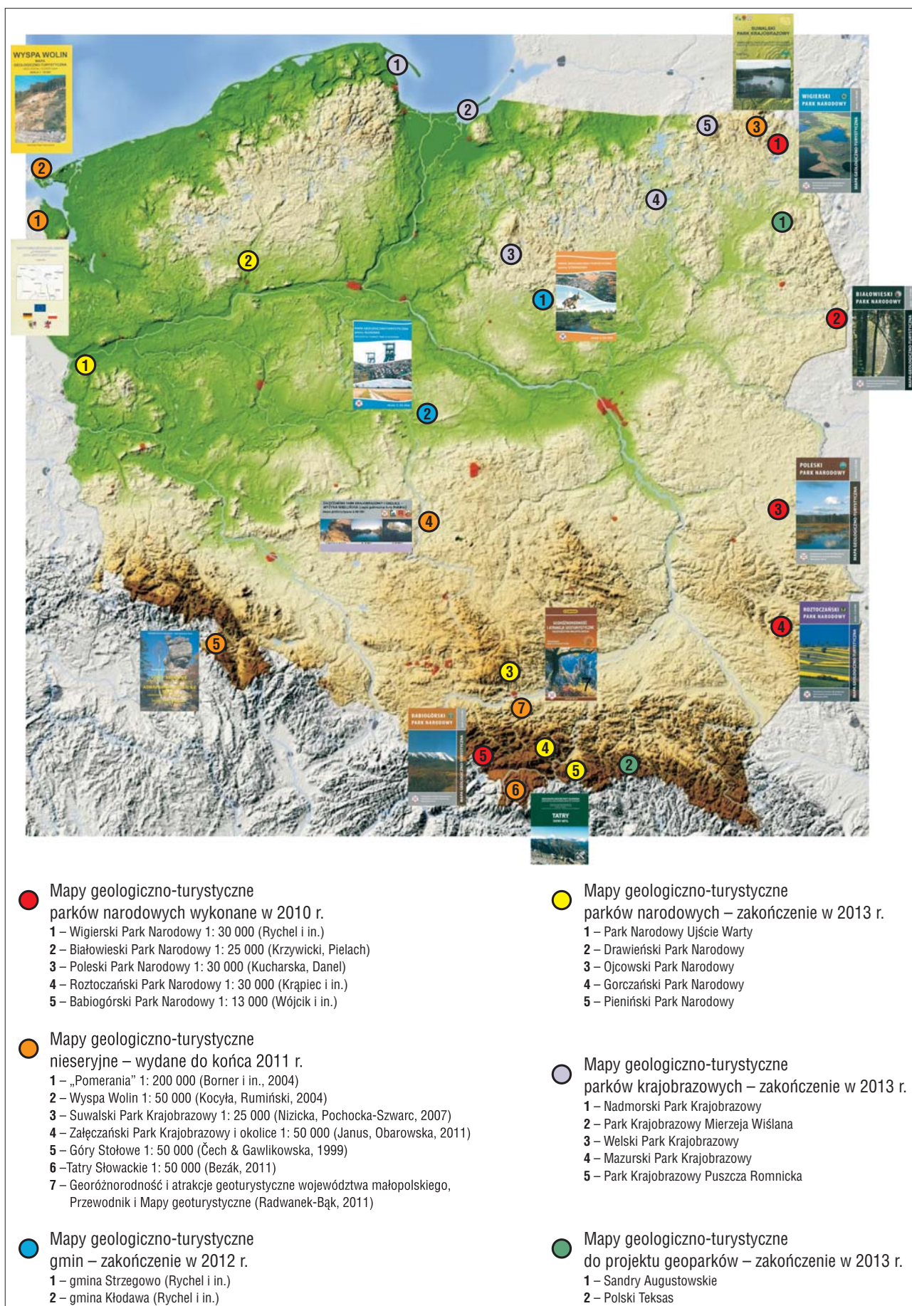
Ryc. 1. Zestawienie wykonanych pod egidą PIG-PIB map geologiczno-turystycznych