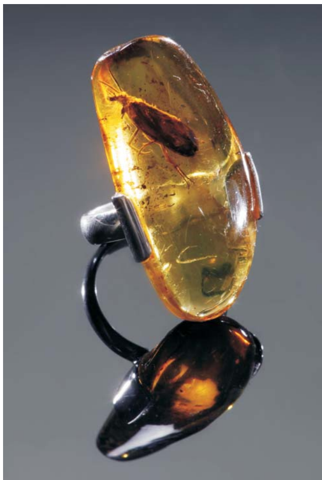
Ryc. 3. „Inkluzja”, pierścionek; bursztyn z chrzączką, srebro; 8,4 g; bursztyn przezroczysty żółty, wykonanie Andrzej Szadkowski; 2001.