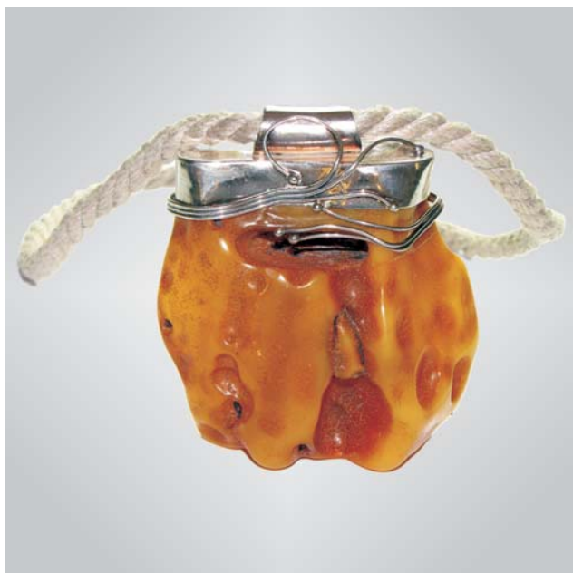
Ryc. 1. Wisior; bursztyn, srebro, sznurek; 196,8 g; bursztyn mieszany żółty, wykonanie Bogdan Sawicki. Ryc. 1, 2, 4 fot. M. Kazubski