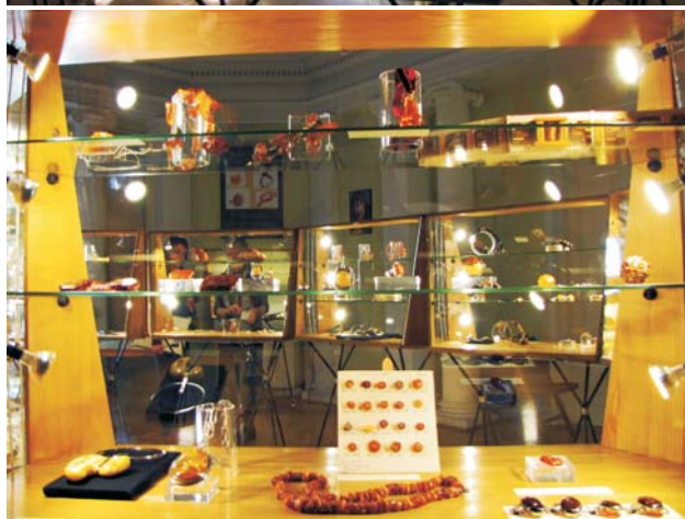
Ryc. 4. Wystawa „Bursztyn nie tylko nad Bałtykiem”