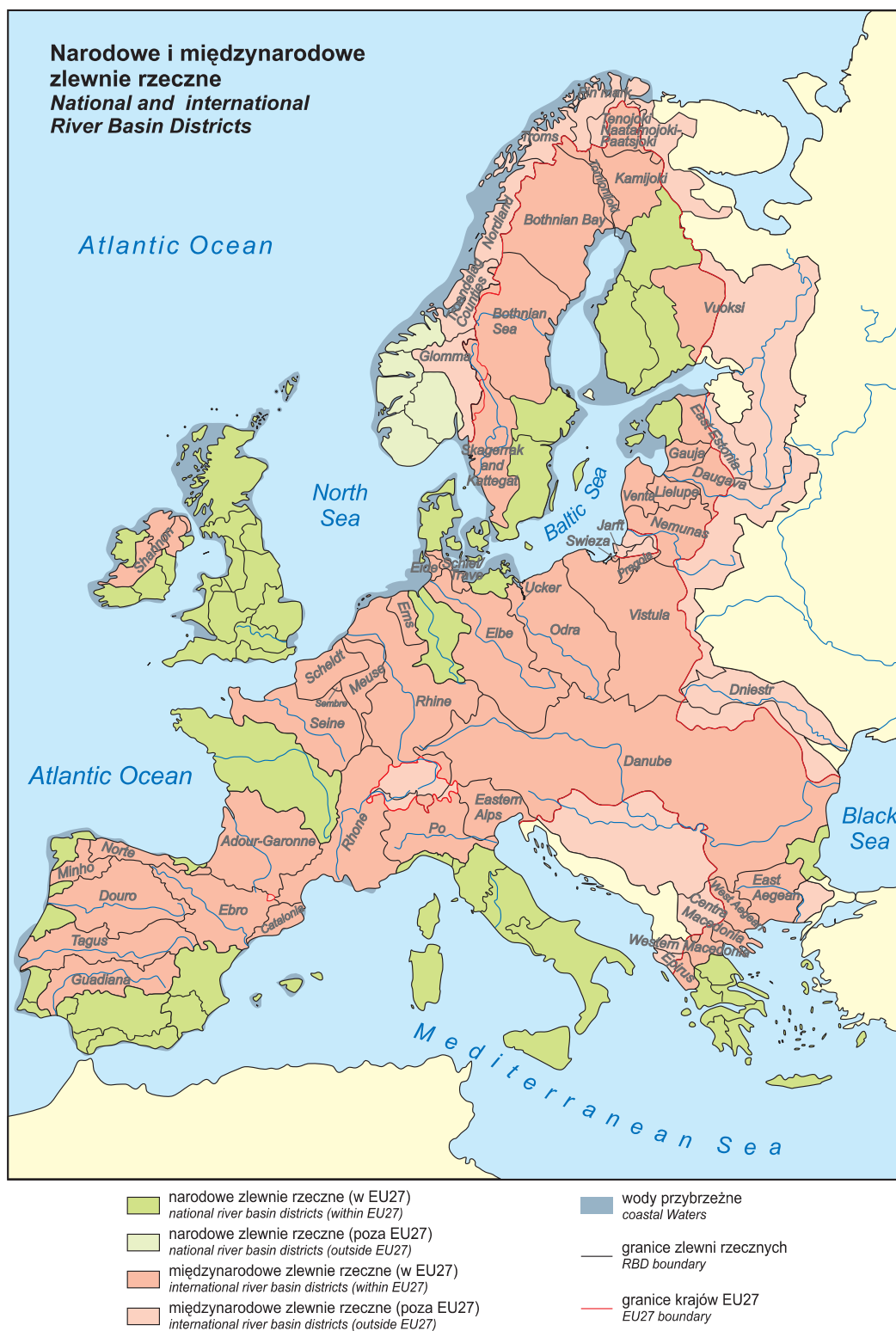
Fig. 4. Krajowe i międzynarodowe zlewnie wód powierzchniowych na obszarze Europy

National and international surface water basins in Europe