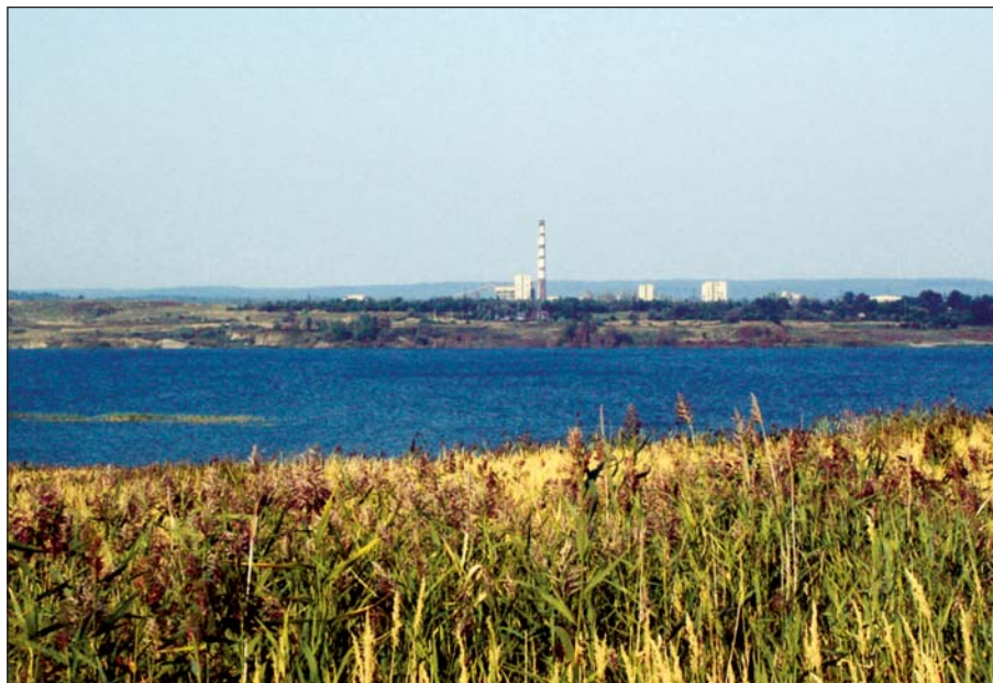
Fig. 1. Krajobraz zatopionego wyrobiska górniczego po odkrywkowej eksploatacji siarki w złożu Jaworow

The landscape underwater sulfur open mining pit in the Jaworow deposit