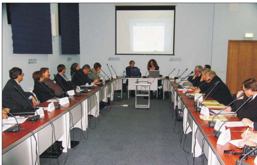
Fig. 3. Uczestnicy projektu NATO podczas obrad w Mińsku (Białoruś)

Podjęte działania są podstawą do budowy pozytywnych relacji pomiędzy ekspertami z poszczególnych krajów granicznych, które w efekcie zmierzają do przygotowania założeń zunifikowanej metodyki zarządzania wodami transgranicznymi. Jest to podstawowe działanie zmierzające do zapewnienia bezpieczeństwa środowiskowego, poprzez zaangażowanie do współpracy szerokiego grona instytucji administracji centralnej i lokalnej obszarów przygranicznych oraz jednostek naukowych. W czasie dyskusji wielokrotnie pojawia się konfrontacja zasad wynikających z RDW z zasadami przyjętymi przez Partnerów Wschodnich w swoich krajach. Jednakże współpraca zakłada podejście partnerskie i wysłuchanie wszystkich stron, a w efekcie wybranie najlepszego rozwiązania, które w przyszłości będzie stosowane przez wszystkie strony. Istotnym wkładem w przyszły system zarządzania transgranicznymi wodami podziemnymi w tym rejonie jest przedstawiona lista rekomendacji dla utworzenia monitoringu transgranicznego (Kazimierski, Piliłchowska-Kazimierska, 2010).