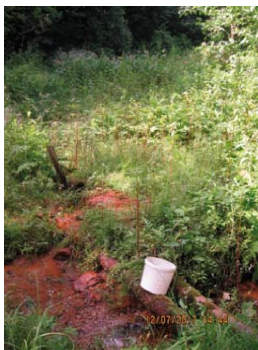
Fig. 2. Źródło drenujące pierwszy poziom wodonośny

Spring draining the first aquifer